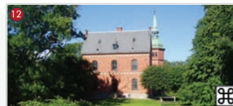
12 Skovsgaard Gods Kågårdsvej 12, Hønenet, 5900 Rudkøbing Tlf.: 62 57 14 15, www.danmarksnaturfond.dk