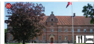
20 Næsbyholm Slot Næsbyholm Allé 7-9, 4191 Glumsø Tlf.: 31 21 01 04, www.naesbyholmslot.dk