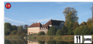
19 Skjoldenæsholm Hotel & Conferencecenter Skjoldenæssevej 106, 4174 Jystrup Tlf.: 57 53 87 50, www.skj.dk