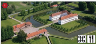
4 Clausholm Slot Clausholmvej 308, Voldum, 8370 Hadsten Tlf.: 86 49 16 55, www.clausholm.dk