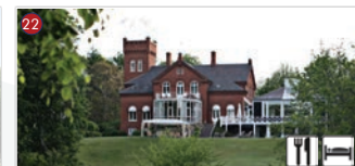
22 Havreholm Slot Klosterrisvej 4, 3100 Hornbæk Tlf.: 49 75 86 00, www.havreholm.dk