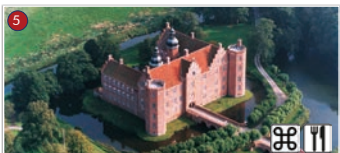
5 Gammel Estrup - Herregårdsmuseet Randersvej 2, 8963 Auning Tlf.: 86 48 30 01, www.gammelestrup.dk