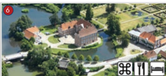
6 Gram Slot Slotsvej 54, 6510 Gram Tlf.: 74 82 00 40, www.gramslot.dk