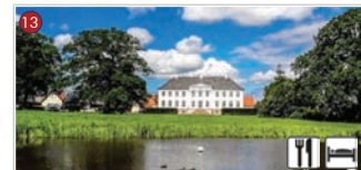
13 Heste Herregaards Pension Aggervold Tornbrinken 24, 4450 Jyderup Tlf.: 59 21 19 89, www.aggervold.dk