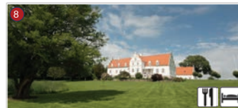
8 Damsbo Gods Strandbyvej 62, 5683 Haarby Tlf.: 43 58 49 49, www.damsbogods.dk