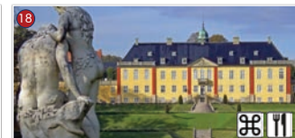
18 Ledreborg Slot Ledreborg Allé 2, 4320 Lejre Tlf.: 46 48 00 38, www.ledreborg-slot.dk