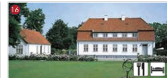
16 Merløsegaard Herregaard Stibjærgvej 34, 4370 Store Merløse Tlf.: 57 80 00 17, www.merloesegaard.dk