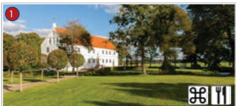
1 Staarup Hovedgaard Siårupgårdvej 10, 7840 Højslev Tlf.: 20 89 52 11, www.staaruphovedgaard.dk