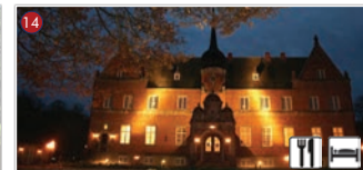
14 Selchausdal Gods Selchausdalvej 6, 4291 Ruds Vedby Tlf.: 58 25 01 27, www.selchausdal.dk