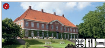
7 Hindsgavl Slot Hindsgavl Allé 7, 5500 Middelfart Tlf.: 64 41 88 00, www.hindsgavl.dk