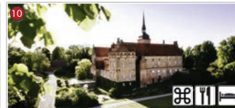
10 Holckenhavn Slot Holckenhavn 1, 5800 Nyborg Tlf.: 65 31 31 05, www.holckenhavn.dk