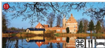
11 Broholm Slot Broholmsvej 32, 5884 Gudme Tlf.: 62 25 10 55, www.broholm.dk