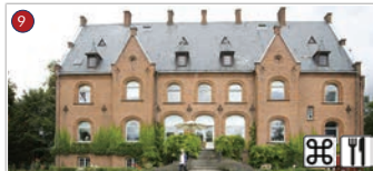
9 Sanderumgaards Romantiske Have Sanderumgaardvej 150, 5220 Odense SØ Tlf.: 26 19 21 30, www.sanderumgaard.dk