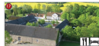
17 Sonnerupgaard Gods Tølløsevej 53, 4330 Hvalsø Tlf.: 46 40 95 31, www.sonnerupgaard.dk